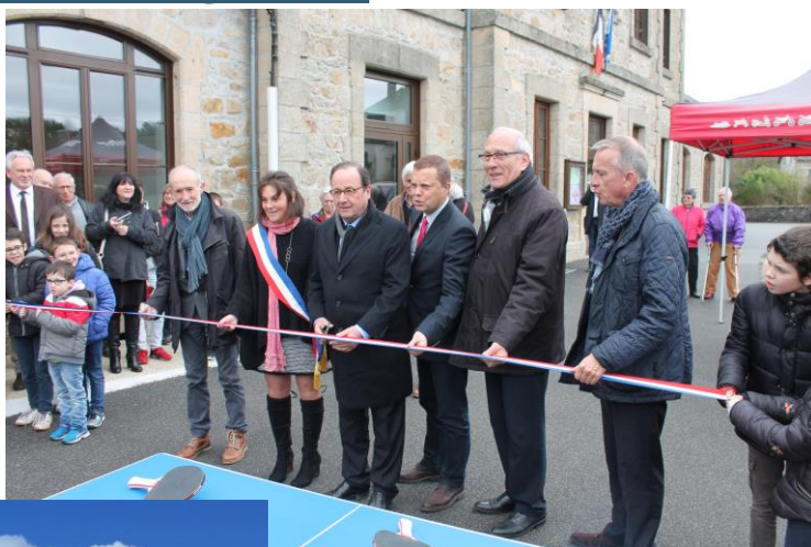
Inauguration de la cantine et de la table de ping-pong le 16 Mars 2019