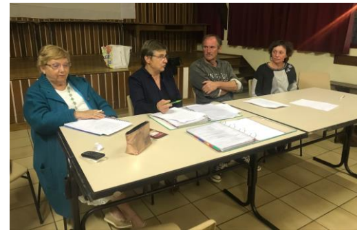
Assemblée générale 14 Mai à Saint

ATTENTION à partir du 6 septembre 2019, la récupération des colis se fera dans le local des associations.