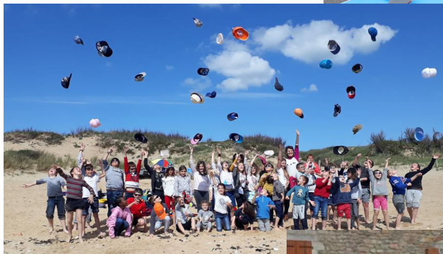
Classe de mer des élèves à la Martière d'Oléron du 29 Avril au 3 Mai